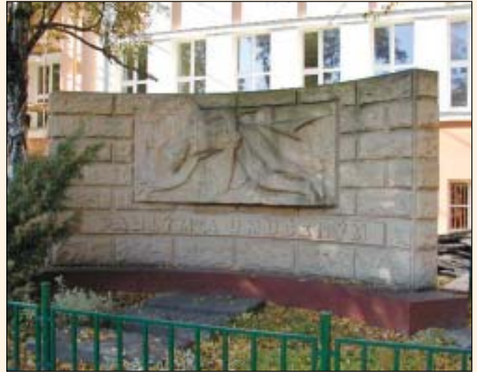
Památník se nachází na ulici Matrosovově v O.-Hulvákách, vyroben z pískovce s reliéfem a nápisem „Padlým a umučeným“.

V Hulváckém lesíku kolem 16. hodiny dávali obyvatelé bílou látkou znamení Rudé armádě, že Hulváky jsou bez fašistů. V městském sběrném kanálu byly místními zneškodněny