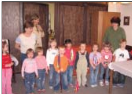
Dne 5. 4. 2007 přišla milá návštěva z MŠ Varenské na DPS Novoveská, aby popřála šťastné a veselé Velikonoce.