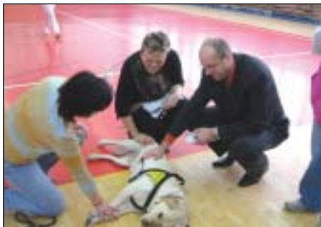
Dne 30. 3. 2007 proběhl na Vyšší odborné škole zdravotnické DEN ZDRAVÍ.