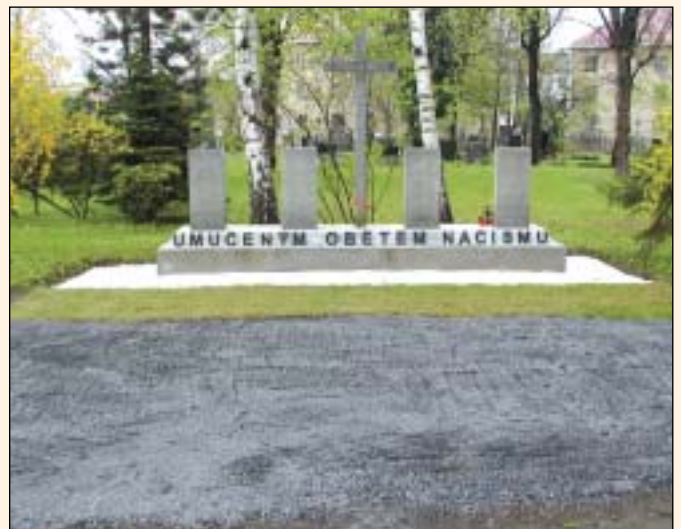
Památník umučeným obětem nacismu se nachází na místním hřbitově. Jde o kamenný podstavec s nápisem „Umučeným obětem nacismu“ s vyrytými jmény umučených.