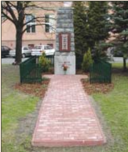
Památník na paměť umučeným za svobodu vlasti, ul. Podlahova, jedná se o kamenný sloup ve tvaru jehlanu s pamětní deskou, na které jsou vyryta jména umučených.

Na šachtě, v koksovne a elektrárně Ignát (později Jan Šverma) a v dusikárnách hlídkovalo jen osazenstvo bydlic v nejbližším okolí. Všechny obchody byly zavřeny. Německé obyvatelstvo bylo už začátkem dubna nuceně evakuováno.